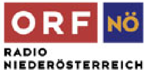
ORF – Lokalsender