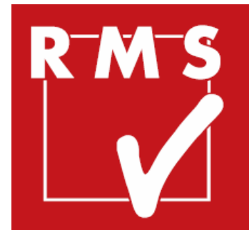
Radio Marketing Service ( Private Sender )